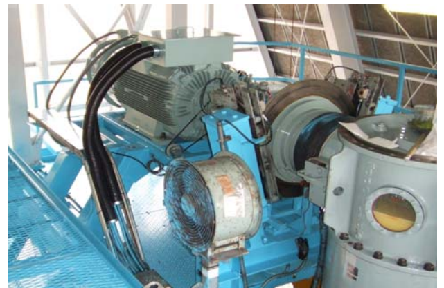
交流原動機・減速機の更新