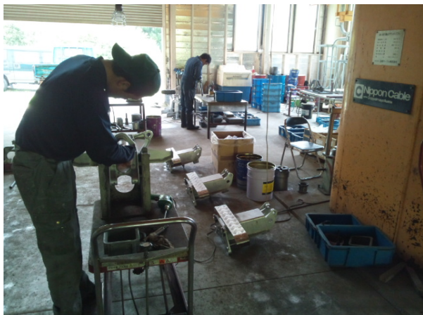
メインパーツ交換作業

めいほう第3クワッドリフト支えい索の切詰、めいほう第2クワッドリフト握索機6年検査（分解整備）とクランプブロック・メインパーツ一部更新、めいほう第4クワッドリフト風速計分解整備、めいほう第3クワッドリフト油圧制動ユニットの更新、めいほう第1・第2ペアリフト握索機分解整備等を実施しました。