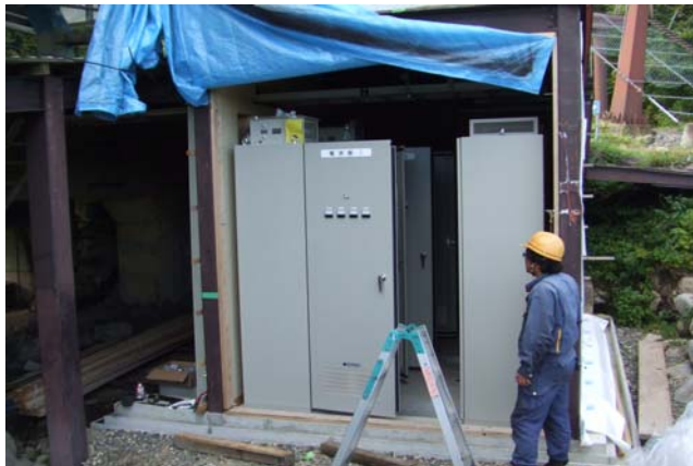
インバーター制御へ更新

平成24年度は、めいほう第1クワッドリフトの減速機・原動機・制御盤・制動ユニット・滑車軸を更新。