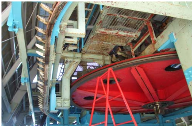
滑車軸・ベアリング更新