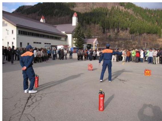
避難訓練と消火器の取扱い

また、索道技術管理者講習会（日鋼協主催）、並びに索道技術講習会に参加による、安全教育を実施しています。