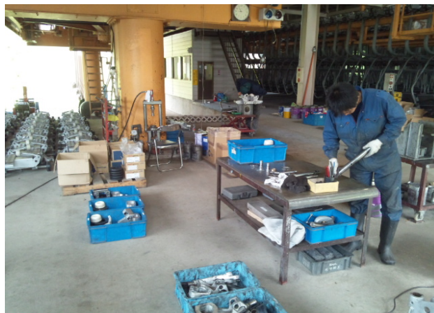
握索機6年分解整備